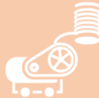
การทอผ้า

ดัชนีผลผลิต -80.83% ดัชนี การส่งสินค้า -75.85% ดัชนีสินค้าสำเร็จรูป คงคลัง -54.86%