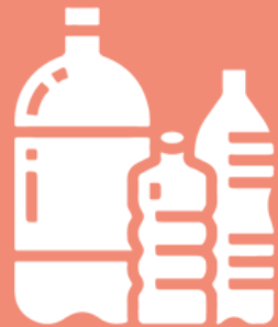
เครื่องดื่มไม่มีแอลกอฮอล์ น้ำดื่ม น้ำแร่ บรรจุขวด

ดัชนีผลผลิต -10.64% ดัชนี การส่งสินค้า -12.45% ดัชนีสินค้าสำเร็จรูป คงคลัง +4.31%