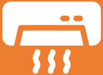
เครื่องปรับอากาศ

หมายเหตุ: ข้อมูลเรียงลำดับตาม Contribution ของค่าต่างดัชนีผลผลิตอุตสาหกรรม