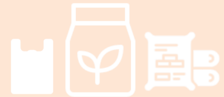
บรรจุภัณฑ์พลาสติก

ดัชนีผลผลิต -22.89% ดัชนี การส่งสินค้า -15.47% ดัชนีสินค้าสำเร็จรูป คงคลัง -11.84%